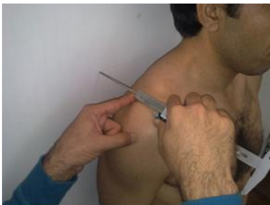
شکل ۱: اندازه گیری فاصله آخرومی

اندازه گیری فاصله آخرومی ۴ : فاصله آخرومی فاصله بین لبه خلفی زائده آخرومی استخوان کتف تا دیوار است که در وضعیتی که آزمودنی پشت به دیوار باشد اندازه گیری می شود. آزمودنی در وضعیت پشت به دیوار به طوری که پشت پاشنه و تنه روی دیوار قرار داشت و به حالت ریلکس می ایستاد. ابتدا فاصله افقی بین لبه خلفی زائده آخرومی استخوان کتف تا دیوار با استفاده از کولیس در این حالت اندازه گیری می شد. سپس آزمودنی هر دو شانه خود را در جهت دیوار بطوری که پشتش بر روی دیوار بماند و وضعیت قبلی را حفظ کند بالا می آورد. مجدداً در این حالت فاصله افقی بین لبه خلفی زائده آخرومی استخوان کتف تا دیوار اندازه گیری می شد. سپس اختلاف این دو فاصله به عنوان فاصله آخرومی ثبت می شد (۲۱). (شکل ۱)