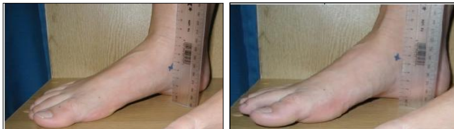
وضعیت بدون تحمل وزن

اندازه‌گیری افت استخوان ناوی: از آزمون افت ناوی برای تعیین میزان چرخش داخل پا استفاده شد. از آزمودنی خواسته شد روی صندلی بنشیند، درحالی‌که ران و زانوی او در وضعیت فلکشن ۹۰ درجه، کف پاهای او روی زمین و مفصل ساب تالار او در وضعیت خنثی قرار داشت (بدون تحمل وزن). آزمونگر برجستگی استخوان ناوی آزمودنی را لمس و مارک کرده و فاصلهٔ آن را تا زمین با خطکش اندازه می‌گرفت. سپس از آزمودنی خواسته می‌شد در وضعیت ایستاده قرار گیرد و پاها را به اندازهٔ عرض شانه باز کند و وزن بدن را به‌طور مساوی روی دو پا قرار دهد (تحمل وزن). فاصلهٔ استخوان ناوی تا زمین دو بار اندازه‌گیری شد (شکل ۱). اختلاف بین این دو وضعیت به میلی‌متر به‌عنوان میزان افت ناوی ثبت شد (برودی). اندازه‌گیری در پای چپ و راست آزمودنی‌ها ۳ بار تکرار و میانگین آن به‌عنوان افت استخوان ناوی ثبت شد (۱۷، ۱۲، ۸).