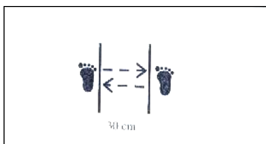
شکل ۳- آزمون جهش جانبی

آزمون جهش جانبی ۱ : در این آزمون آزمودنی‌ها می‌بایست فاصله ۳۰ سانتی‌متری روی زمین را که با تکه نوار چسب موازی مشخص شده بود، ۱۰ بار به صورت رفت و برگشت بر روی پای مورد بررسی خود جهش کنند (شکل ۳). از آنها خواسته شد مسیر را با بیشترین سرعت با پای برهنه جهش کنند. رکورد آزمودنی‌ها با زمان سنج با دقت ۰/۰۱ ثانیه ثبت شد (۱، ۱۱).