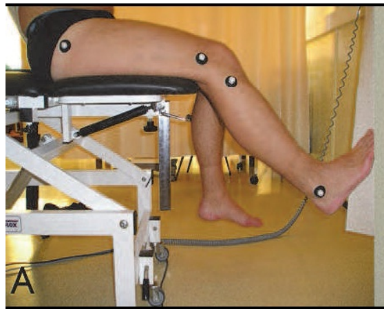
شکل ۱. اندازه‌گیری حس وضعیت زانو